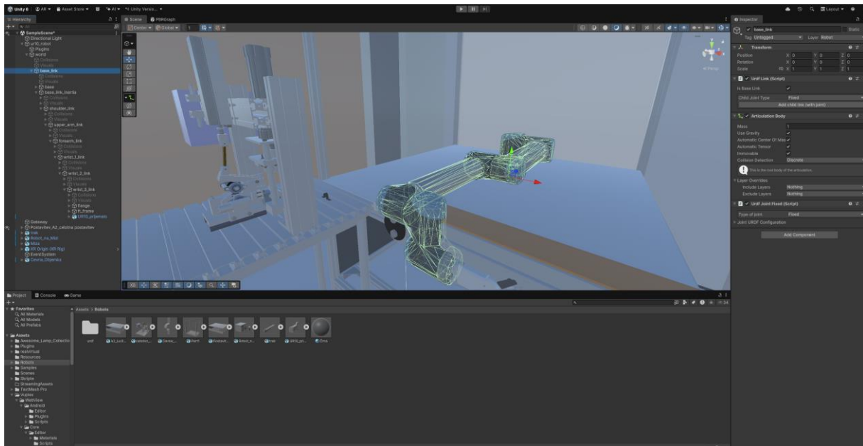
Slika 2: Upogibalna naprava za izdelavo cevnih objemk in robotska celica z UR 10 za manipulacijo z materialom v Unity.

Sistem temelji na dvosmerni povezavi med resničnim in virtualnim okoljem, kar omogoča spremljanje procesov v realnem času – bodisi prek računalnika, VR-očal ali neposredno na fizični napravi. Ta integracija zagotavlja zelo realistično simulacijo, ki študentom omogoča analizo gibov, optimizacijo postopkov in preizkušanje različnih scenarijev brez tveganja poškodbe opreme.